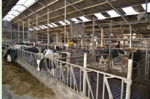
2. Zijl 1, Hollandse stal