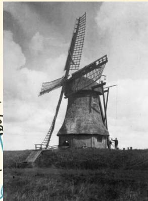
De Haanmeer werd bemalen door twee windmolens. Het afgebeelde exemplaar stond aan de Houkesloot, de andere aan de westkant van het meer, aan de Yndyk.