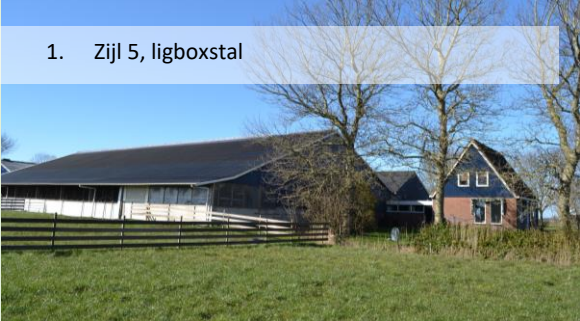
1. Zijl 5, ligboxstal