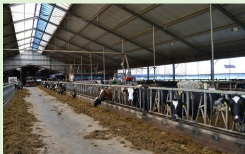
4. Haanmeer 9, traditionele Friese stal