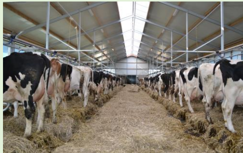
1. Zijl 3, ligboxstal, melkrobot