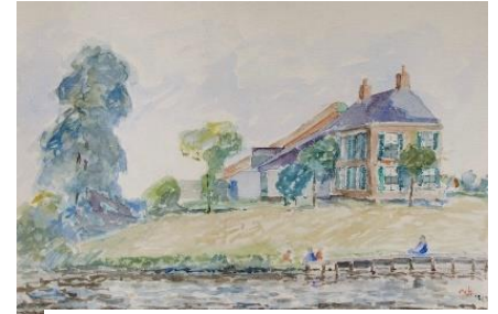
aquarel van Galamadammen 1943