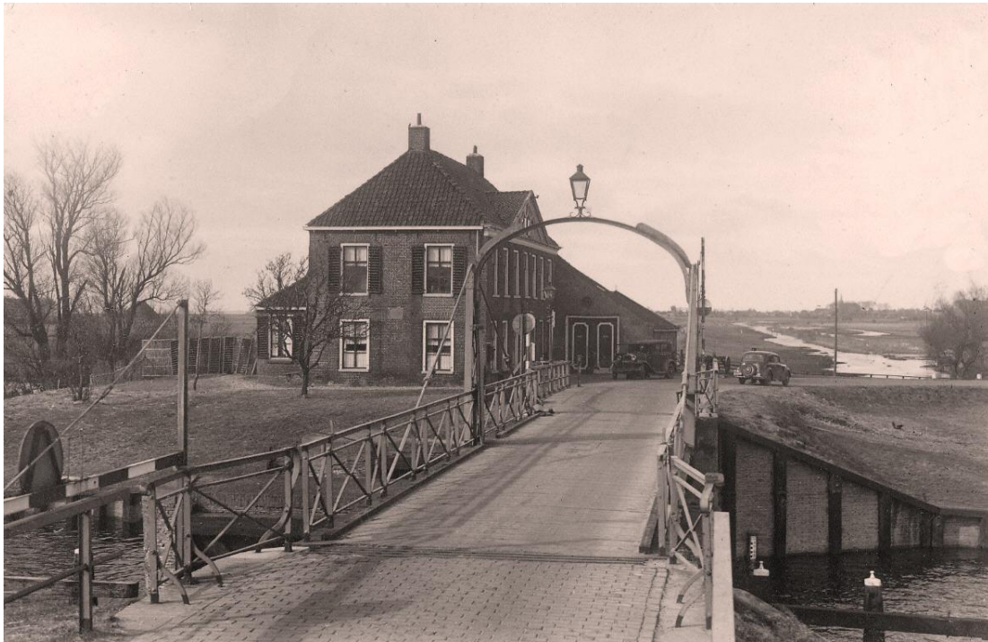
Dit wie de situasje op Galamadammen yn Pier syn bernejierren. Mear nei achteren is de spits fan de tsjerketoer te sjen.