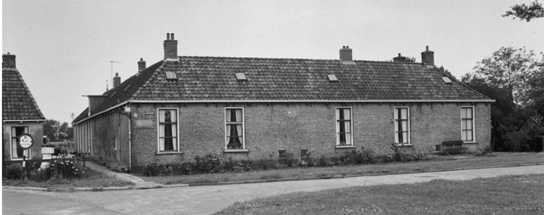
'Tehuis voor ouden van dagen', stie op it buordsje mar elkenien sei Earmhús. It stie oan it Healepaad, sawat underoan, op nei de Easte.

der altyd wol west en hij wenne yn 't earmhús. Ja sa neamden se sa'n tehús eartiids, hurd no.