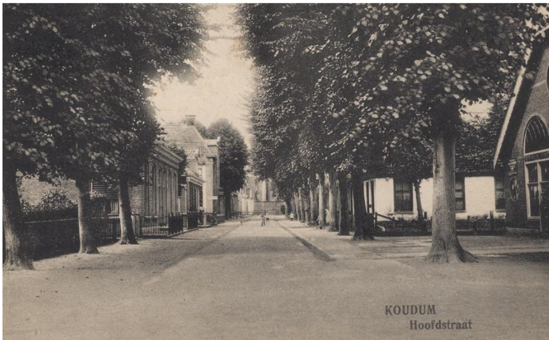
It plak fan de hynste- en bollekeuringen links en rjochts 'Het wapen van Friesland'. In eintsje fierderop it gemeentehús, de gevel dy't wat útsteekt.